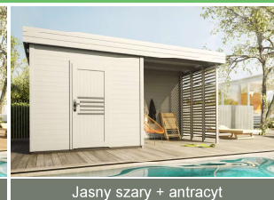
Jasny szary + antracyt