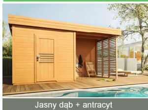
Jasny dąb + antracyt